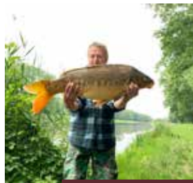
Autor: Olga Nittelová