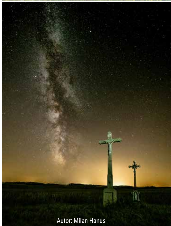
Autor: Milan Hanus