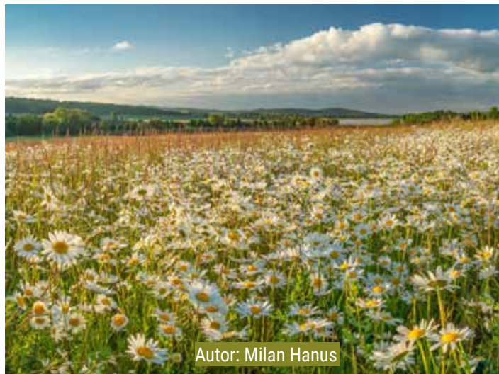
Autor: Milan Hanus