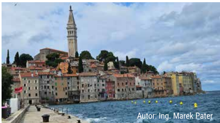
Autor: Ing. Marek Pater