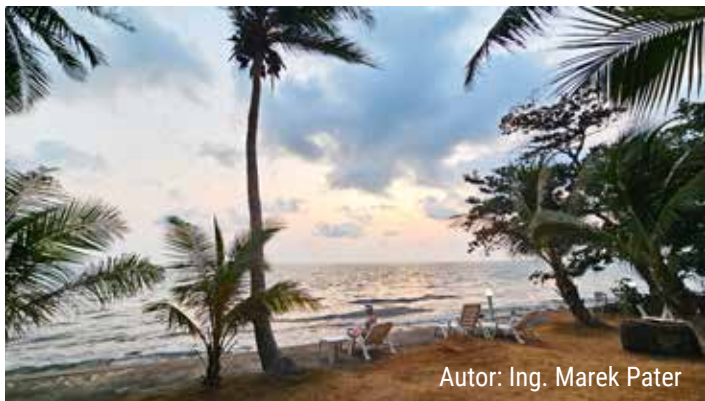
Autor: Ing. Marek Pater

P ojdme si i v sychravém počasí podzimu připomenout léto, a to v báječných fotografiích, které nám zaslali naši čtenáři. Děkujeme všem za zasláné fotopříspěvky. Autoři zveřejněných snímků obdrží malou pozornost.