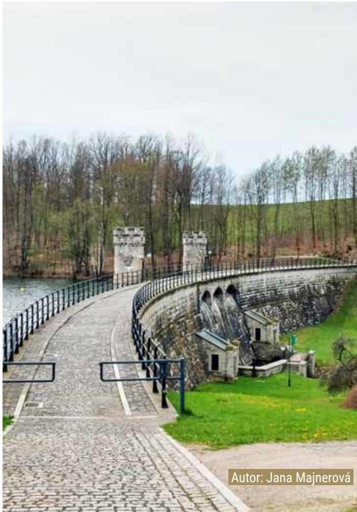
Autor: Jana Majnerová