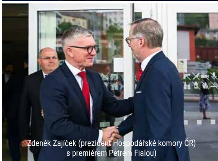
Zdeněk Zajíček (prezident Hospodářské komory ČR) s premiérem Petrem Fialou)