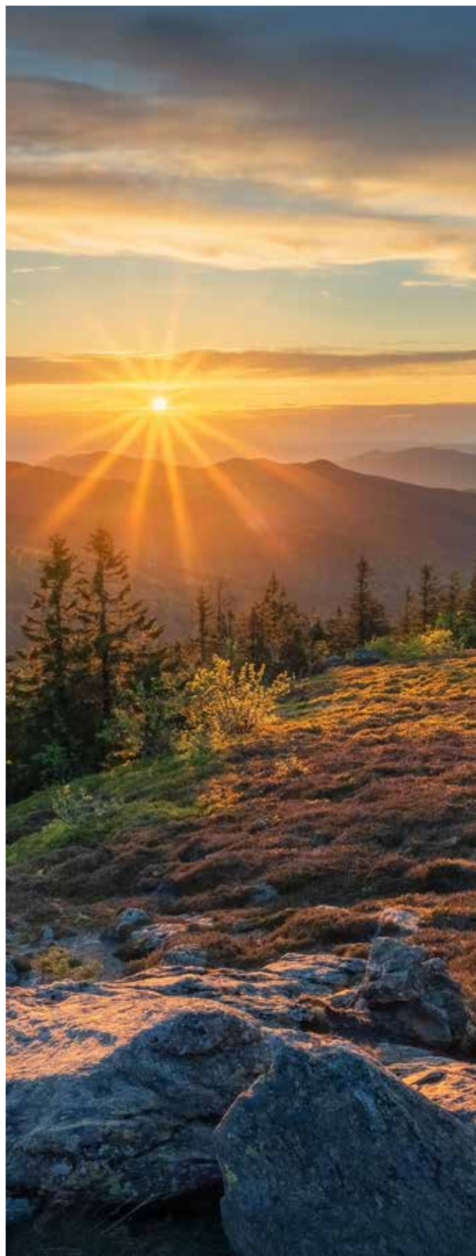
Titulní strana obálky: OTAVA, výrobní družstvo, Zlatý Amper 2025

Svaz českých a moravských výrobních družstev Redakce časopisu Výrobní družstevnictví Václavské nám. 21, 110 00 Praha 1 Šéfredaktorka, grafika: Jana Henychová tel.: +420 224 109 352