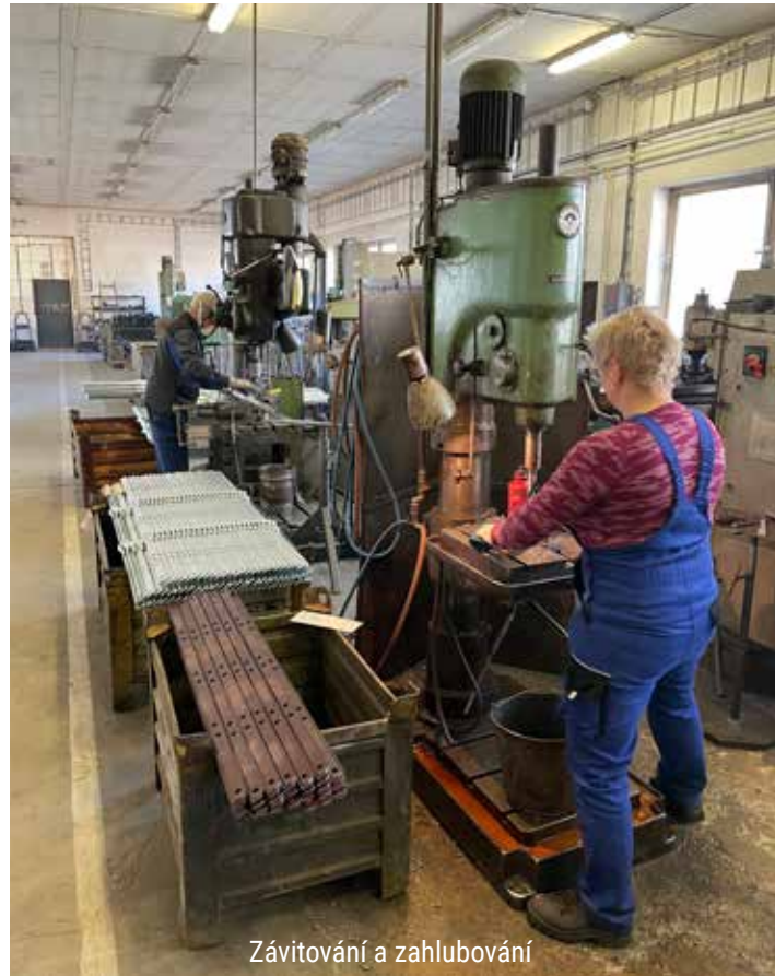
Závitování a zahlubování

KOVODRUŽSTVO v současnosti intenzivně pracuje na zavedení nových webových stránek a internetového obchodu (e-shopu) propojeného se skladovou evidencí. Nedávno byl ve firmě implementován nový informační systém Helios Orange iNuvio, který propojuje všechny podnikové procesy a umožňuje optimalizaci výroby i skladového hospodářství. Díky tomu se družstvo nyní může více zaměřit na zvyšování efektivity výroby, snižování výrobních a režijních nákladů a zároveň na zpřesnění plánování výroby a sledování stavu rozpracovaných zakázek.