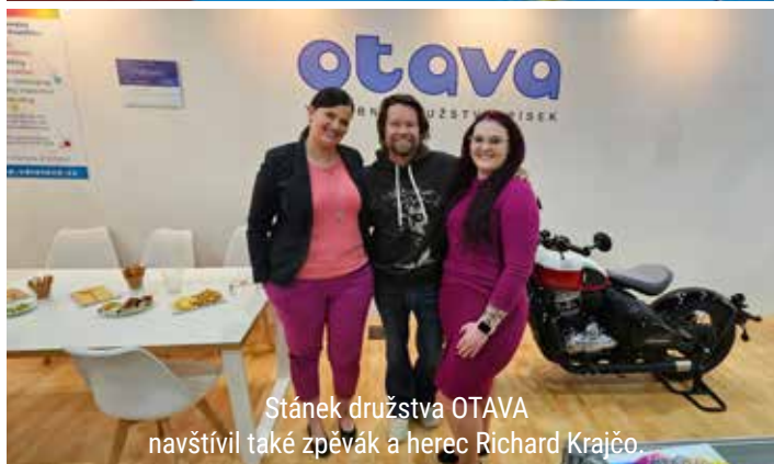
Stánek družstva OTAVA navštívil také zpěvák a herec Richard Krajčo.