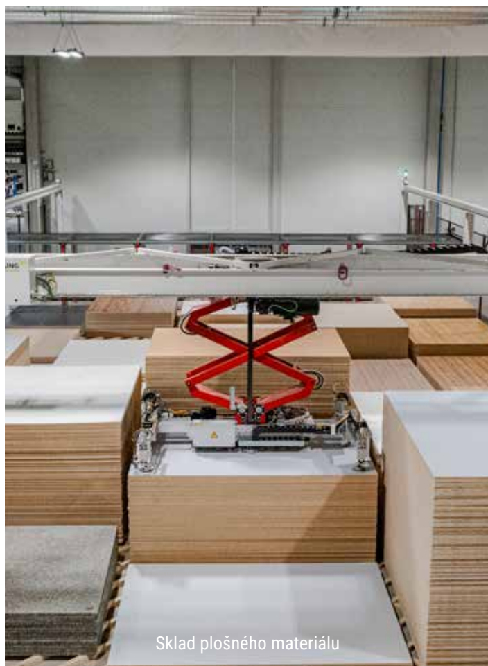
Sklad plošného materiálu

Dalším významným mezníkem byl rok 2002 – změnou majitelů se z družstva Dřevojas stala stoprocentní rodinná česká firma, bez účasti zahraničního kapitálu. Od té doby pak nastal výrazný posun – neustále se rozšiřovala výroba, vznikaly nové a neotřelé vzory koupelnového nábytku, firma začala používat nejmodernější technologie a postupy pro ekologickou výrobu. Velký důraz byl kladen na marketing a propagaci, firma změnila logo, spolupracovala s mnoha designéry, včetně studentů odborných škol. Její koupelnový nábytek působil originálně, zajímavě a výrazný podíl na jeho vzhledu měl i vysoce kvalitní materiál.