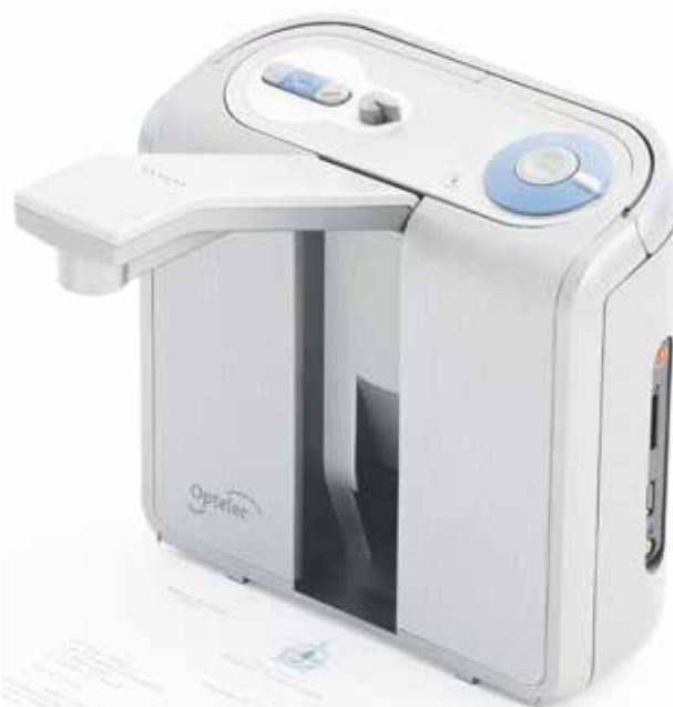
Čtečka pro nevidomé