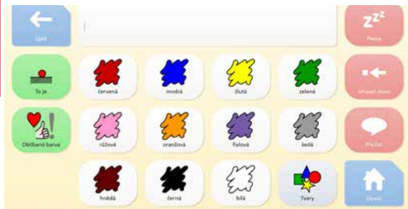
Komunikační tabulka - barvy