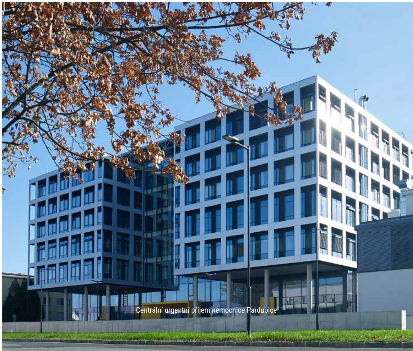
Centrální urgentní příjem nemocnice Pardubice

Barevnost stavby je do velké míry předurčena i jejím významem. A tak jako má působit a působí signálně žlutá v nemocnicích, tak jsme se potkali v rámci našich zakázek i s velmi hravou barevnou kombinací. S cílem pobavit a podpořit dětskou hravost vybral architekt MŠ Větrník v Říčanech u Prahy kombinaci čtyř barevných odstínů - žluté, modré, zelené a oranžové a jejich umístění zvolil podle jednotlivých křídel budovy, které jsou zároveň třídami školky s doplněním o bílý vstup. A tak jako v případě nemocnice, funguje i zde volba barev pro zjednodušení orientace. Dětem barva jejich třídy pomáhá při orientaci ve školce.