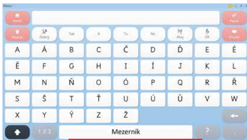
Komunikační tabulka - klávesnice