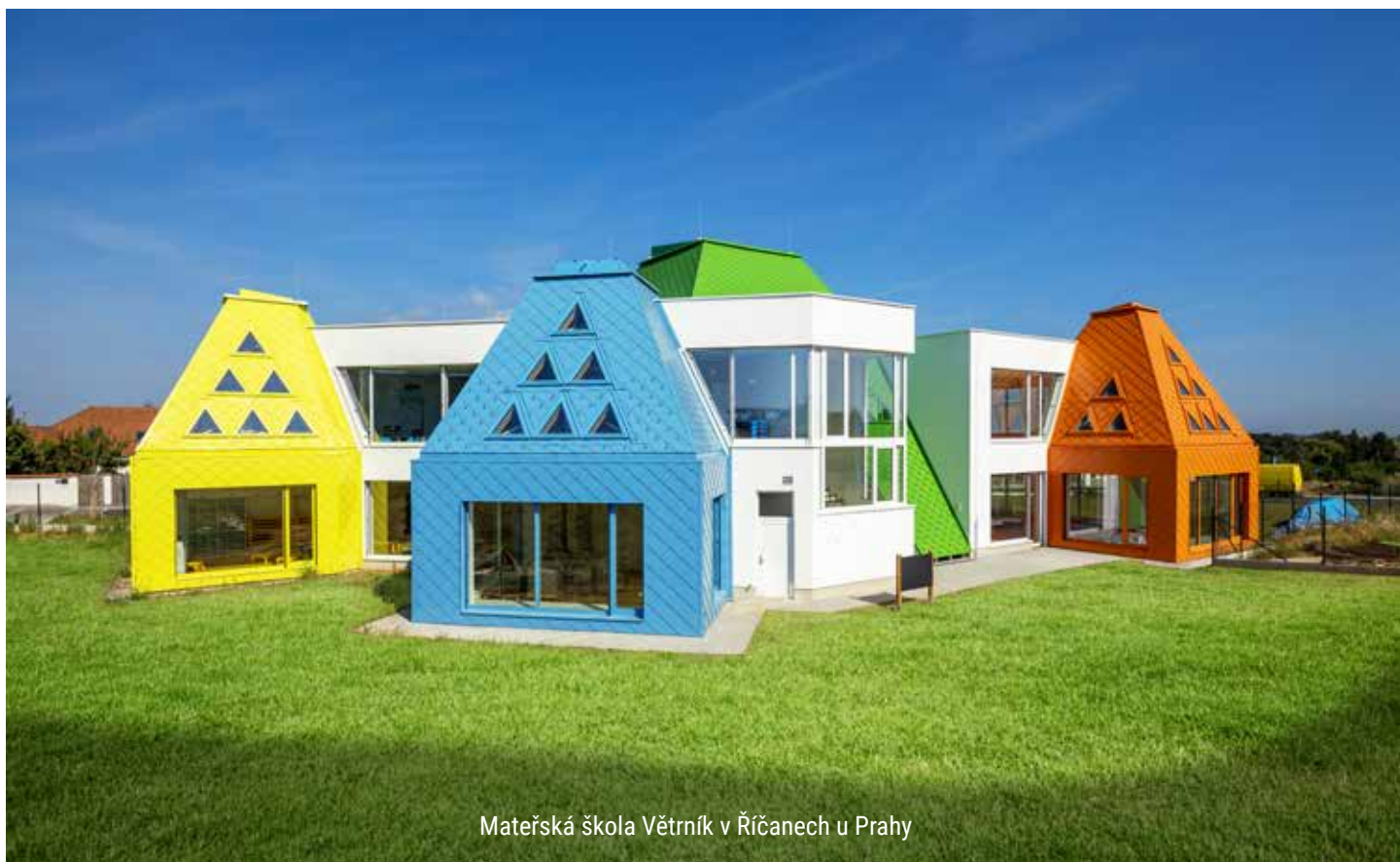
Mateřská škola Větrník v Říčanech u Prahy

Největším a dlouhodobě moderním trendem je stále šedá barva profilů a její odstíny. Za nejvíce oblíbenou barvu platila dlouho antracitově šedá, tu postupem času nahrazují dnes už nadčasově grafitově šedá a černošedá, které jsou tmavší. Někteří architekti a zákazníci si pro svá okna volí i světlejší odstíny šedé a stříbrnošedé, avšak jejich cílem je vždy nezapřednout do nudné šedi stavby a barvu často doplňují jinými výraznějšími prvky. Mechanika se v rámci realizovaných staveb pyšní mnohými, u nichž použila variantu šedé. Nedávno dokončenou realizací takové stavby je budova Centrálního urgentního příjmu Pardubické nemocnice. V tomto případě architekti antracitovou šedost výplní krásně roztržili ostře žlutou barvou nazvanou dopravní žlutá, která působí signálně, což byl pro architektky v případě nemocnice požadavek a nutnost. Velmi oblíbené jsou také barvy, které imitují přírodní hliník. Mají v sobě zakomponovanou velkou míru stříbrného lesku a na objektech působí velmi atraktivně. Nabízíme je pod názvy hliníkově stříbřitá a hliníkově šedá. Takové odstíny působí moderně a neotřele.