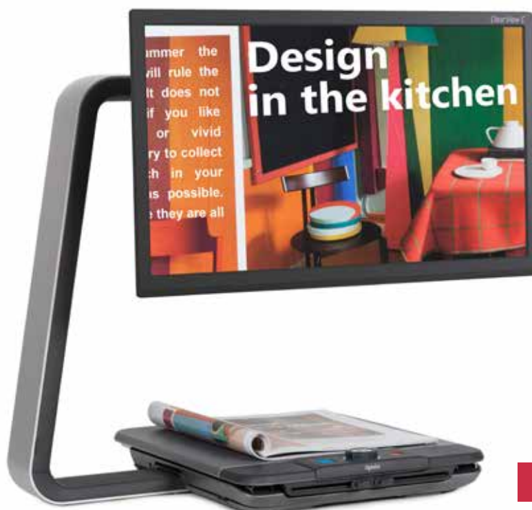
Lupa pro slabozraké