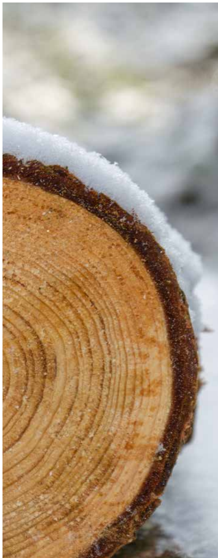
Titulní strana obálky: Spielwarenmesse 2025, foto: Ing. Jan Rott Foto na str. 2 a zadní strana obálky: Pixabay

Svaz českých a moravských výrobních družstev Redakce časopisu Výrobní družstevnictví Václavské nám. 21, 110 00 Praha 1 Šéfredaktorka, grafika: Jana Henychová tel.: +420 224 109 352