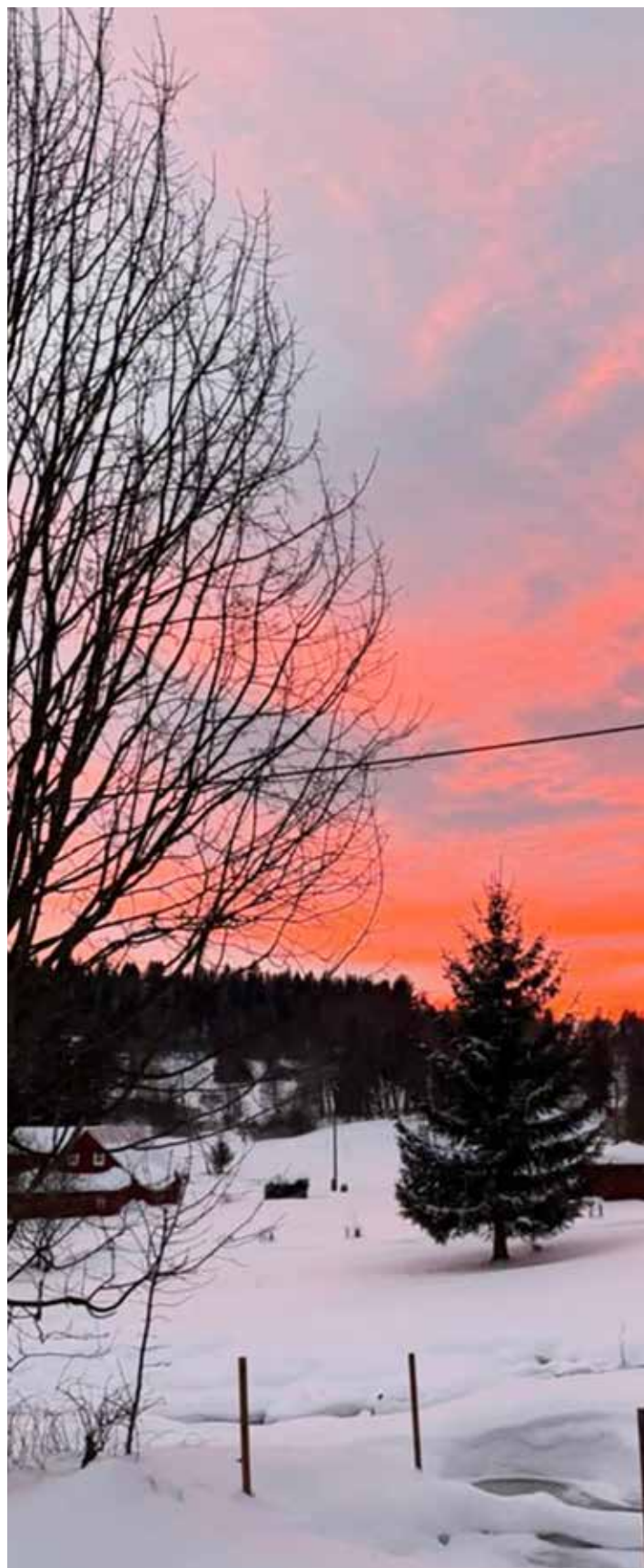
Titulní strana obálky: Pixabay, AlexKlen Foto na str. 2: Jana Majnerová Zadní strana obálky: veletrh AMPER

Svaz českých a moravských výrobních družstev Redakce časopisu Výrobní družstevnictví Václavské nám. 21, 110 00 Praha 1 Šéfredaktorka, grafika: Jana Henychová tel.: +420 224 109 352