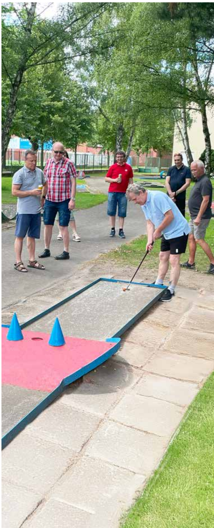
Titulní strana obálky: 34. valné shromáždění SČMVD, foto: Ivan Hladeček