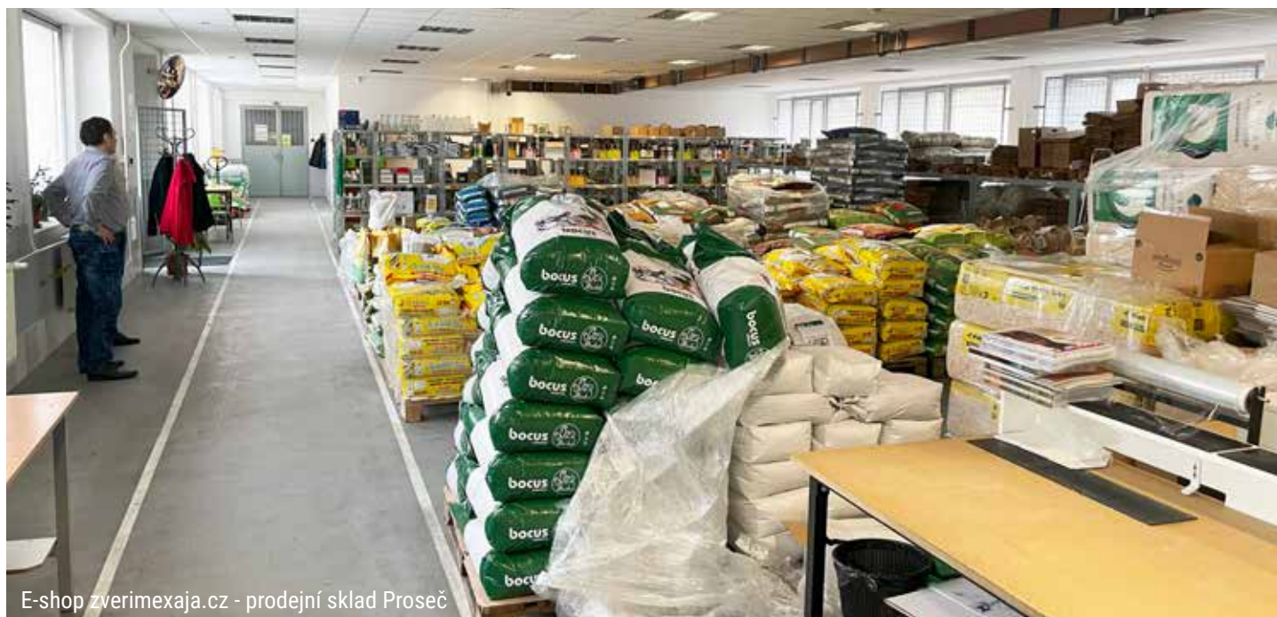
E-shop zverimexaja.cz - prodejní sklad Proseč

Z malé rodinné firmy na východě Čech se postupně stala uznávaná a prosperující skupina ERGOTEP která je dnes předním tuzemským subjektem, jemuž se daří vedle velmi efektivního podnikání realizovat významné společenské a integrační projekty. Znalost sociální problematiky, dlouhodobá stabilita, konkurenceschopnost a kvalita služeb i produktů, které poskytuje, přispívá k hodnotnému ob-