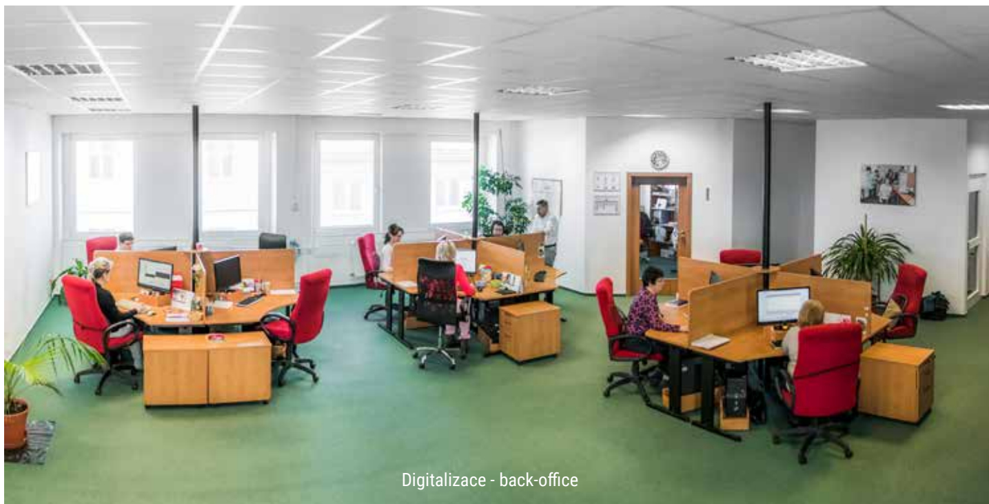
Digitalizace - back-office

chodnímu vztahu. Lidský a odborný potenciál bezmála 200 zaměstnanců, z toho téměř 89 procent se zdravotním znevýhodněním umožňuje hrát významnou roli při vytváření kvalitního prostředí pro zaměstnance z řad OZP, klienty, zákazníky i pro celou společnost.