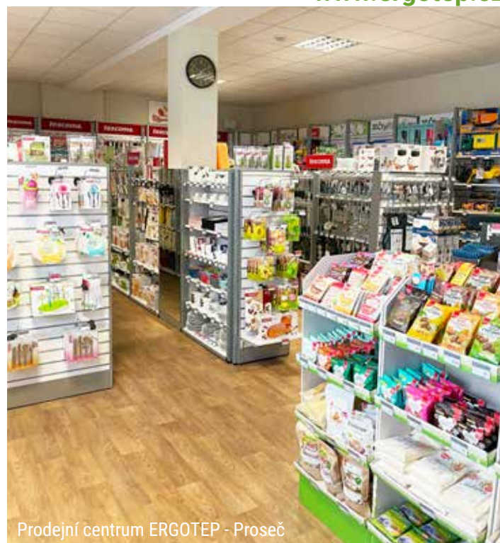
Prodejní centrum ERGOTEP - Proseč