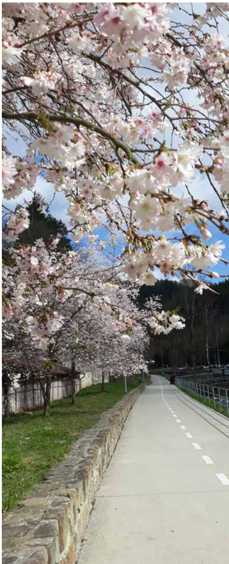
Titulní strana obálky: MODELA Pardubice

Svaz českých a moravských výrobních družstev Redakce časopisu Výrobní družstevnictví Václavské nám. 21, 110 00 Praha 1 Šéfredaktorka, grafika: Jana Henychová tel.: +420 224 109 352