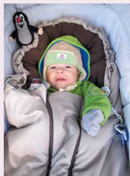
Krtek – výrobce VD Moravská ústředna Brno